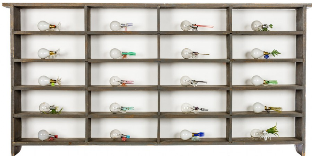
Figuur 3: Carolien Adriaansche, Collectie teken , 2012, lampen, hout en plastic, 128 x 12 x 65 cm.

Aarde is net als Vlinder-in-doos een combinatie van het dierlijke, met het technologische. Een verschil tussen de twee werken is dat Vlinder-in-doos een actie van de toeschouwer vereist, namelijk het bedienen van de hendel, terwijl bij Aarde de toeschouwer zich de actie alleen kan voorstellen.