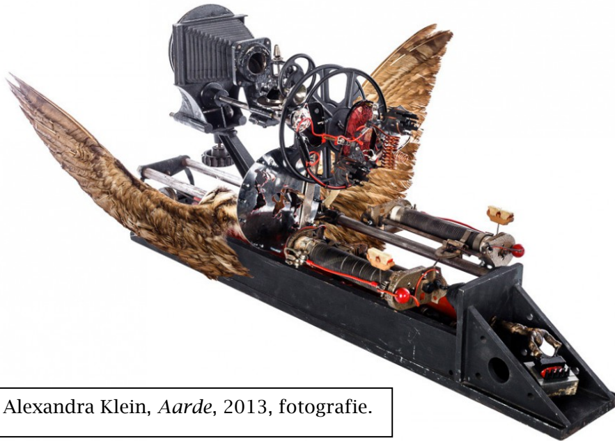
Figuur 2: Alexandra Klein, Aarde , 2013, fotografie.

werp van dit essay, waarvoor vijf werken nader bekeken zijn en geplaatst zijn in de context van de hedendaagse kunst. Ik heb ervoor gekozen om werken te selecteren waarin de natuur in de brede zin, en het dier als onderdeel ervan wordt gethematiseerd.