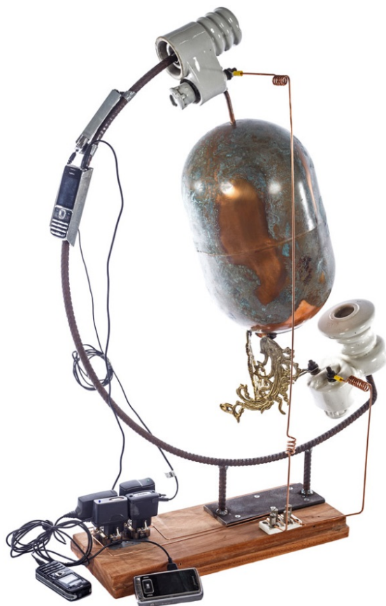
Figuur 4: Kees Jufferman, Moeder u wordt uitgekleeed , 2013, assemblage, 30 x 70 x 90 cm.

Kees Juffermans speelt al in de titel met de metafoor van de aarde als moeder. Het object bestaat uit een bronzen langgerekte ovale vorm die is gemonteerd in een constructie van gebogen staaldraad, waardoor het lijkt op een standbeen met een globe. En ook de verkleuring van de vorm versterkt de