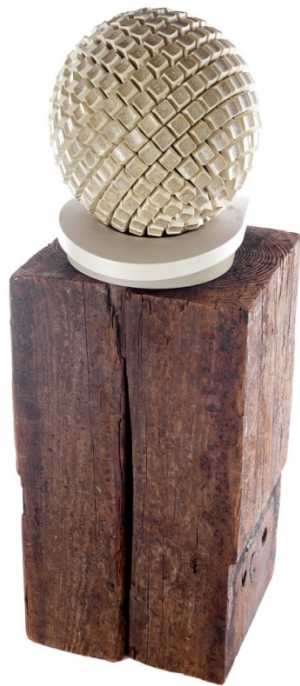
Figuur 5: T&NOK Bannenber&Snel, Ornament AARDE; gaat naar de knoppen. Landing van een wereldwijde identiteitscrisis., 2013, hergebruikte materialen; +/- 475 toetsen van een toetsenbord met lagen van lak/craquelé, bowlingbal, voet van een scherm, 29 x 25 x 81 cm.

Ornament AARDE; gaat naar de knoppen. Landing van een wereldwijde identiteitscrisis (2013) van T&NOK Bannenber&Snel bestaat uit een houten blok waarop een bal op een plastic voetstuk staat die is samengesteld uit knopjes van een toetsenbord. Opnieuw speelt de titel een bepalende rol voor de associaties die worden opgeroepen.